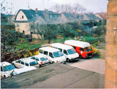
Die Fahrzeuge im Jahr 1994

Kranke und Senioren aufgenommen. Mit den 10 behindertengerecht ausgestatteten Fahrzeugen werden heute jährlich rund 58.000 Personen befördert.