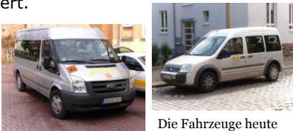
Die Fahrzeuge heute

Kranke und Senioren aufgenommen. Mit den 10 behindertengerecht ausgestatteten Fahrzeugen werden heute jährlich rund 58.000 Personen befördert.