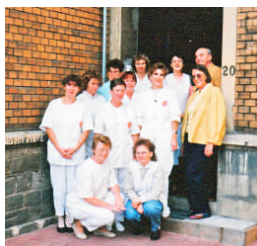
Mitstreiter der ersten Stunden

Am 24. November 1990 erfolgte die Eröffnung der Sozialstation in diesem Haus mit großem öffentlichem Interesse.