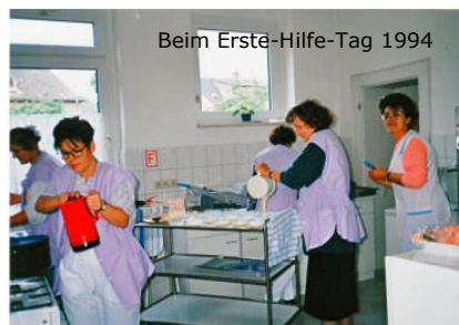
Beim Erste-Hilfe-Tag 1994

Bad Dürrenberg zum betreuten Wohnen für Senioren. Neben den vermieteten 59 Wohnungen ist hier eine Außenstelle des ambulanten Pflegedienstes unseres Kreisverbandes untergebracht.