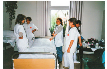
Erste-Hilfe-Tag im Jahr 1994

Im Laufe der vergangenen Jahre wurde der Bedarf an ambulanter Pflege-