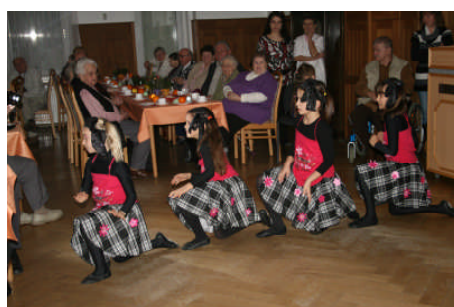
Auch eine Weihnachtsfeier gehört zum Vereinsleben