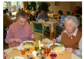
Für das leibliche Wohl in angenehmer Atmosphäre ist gesorgt

Unsere Haltung wird bestimmt durch Wertschätzung, Achtung und Respekt gegenüber dem Menschen und seiner Lebenserfahrung. Das Erleben und Verhalten eines Menschen ist individuell geprägt durch seine Erfahrungen in der Vergangenheit, seine Interpretationen der Gegenwart und seine Erwartungen an die Zukunft.