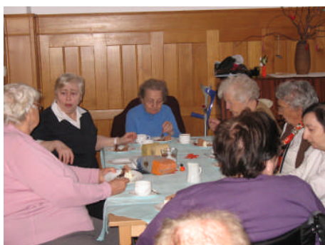
Plaudern beim Kaffee in der Begegnungsstätte Merseburg

Die Mitgliederpflege gilt bei uns als tragendes Element. Veranstaltungen, Ausflüge und Gespräche werden von den Mitgliedern begrüßt.