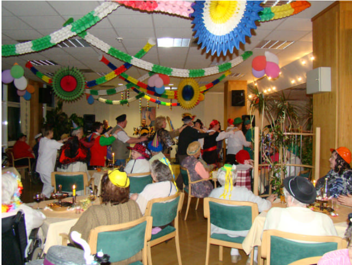
Faschingsfeier mit dem Dürrenberger Carnavalsclub