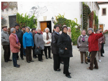
Zu Besuch bei der Märchenfee im Schloss Schkopau

Die Mitgliederpflege gilt bei uns als tragendes Element. Veranstaltungen, Ausflüge und Gespräche werden von den Mitgliedern begrüßt.