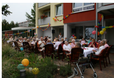
Fröhliche Sommerfeste im Betreuten Wohnen gehören in Bad Dürrenberg dazu