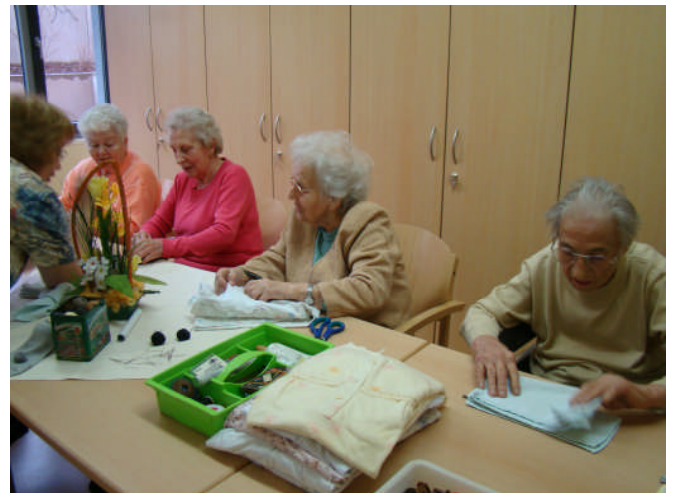
Vertraute hauswirtschaftliche Tätigkeiten unter Frauen

uns wichtig, um die persönlichen Gewohnheiten und die individuellen Sicht- und Verhaltensweisen der Bewohner/innen in Erfahrung zu bringen. Sowohl diese Aspekte als auch die Selbstbestimmung der Bewohner/innen sind richtungsweisend für unser Handeln. Grundlage der Pflege und Betreuung in unserer Einrichtung bildet ein Pflegemodell, welches auf den Ressourcen des Menschen aufbaut.