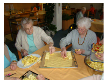
Am Vormittag wird gemeinsam gebacken