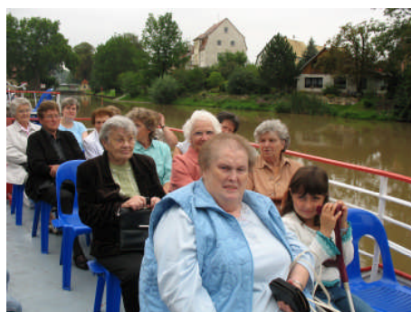
Interessante Ausflugsfahrt mit dem Boot auf der Saale

Der Arbeiter-Samariter-Bund im südlichen Saalekreis bemüht sich, seinen 1.500 Mitgliedern eine soziale Heimstatt zu geben und Möglichkeiten der sozialen Arbeit anzubieten.