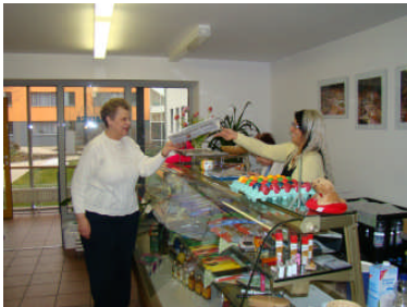
Im hauseigenen Kiosk ist der tägliche Einkauf möglich