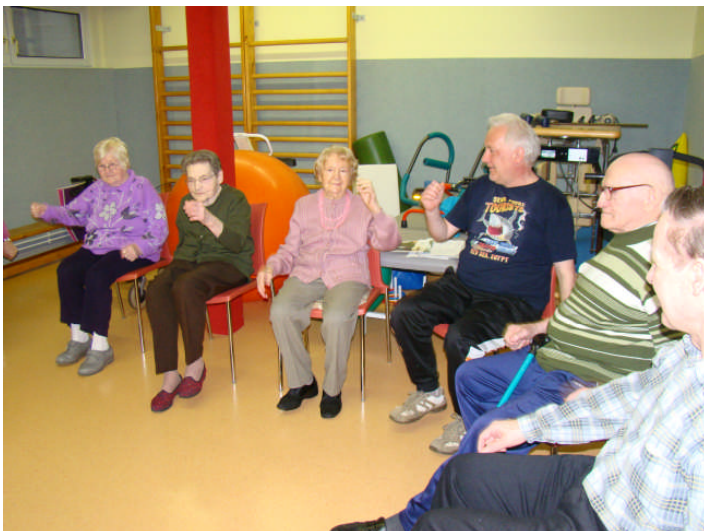
Spaß und Freude beim gemeinsamen Sporttreiben—auch im fortgeschrittenen Alter

Das Wohnen und Leben in unserer stationären Einrichtung in Bad Dürreberg ist geprägt von Normalität und Geborgenheit. Die Atmosphäre ist wohnlich, der Alltag an den Lebensgewohnheiten der Bewohner orientiert. Unsere Mitarbeiter sind Ansprechpartner für alle Belange. Angehörige und andere Menschen aus der Gemeinde können mit einbezogen werden. In unserer stationären Pflegeeinrichtung leben Menschen, die auf Grund chronischer Erkrankungen, psychischer und / oder körperlicher Einschränkun-