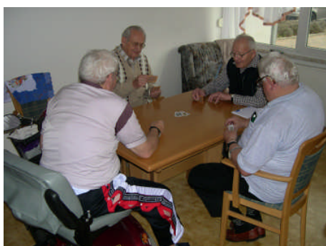
Skatrunde im Betreuten Wohnen in Bad Dürrenberg

Unsere Mitglieder erwarten zunehmend Leistungsangebote, die dazu beitragen, Einschränkungen, die durch das Alter entstehen, zu überwinden oder zu mildern.